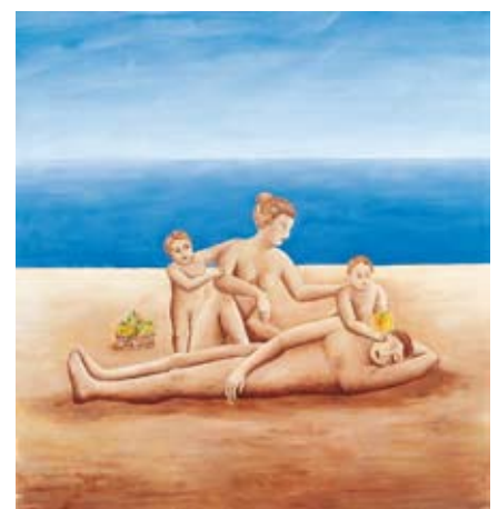
Eve, Adam, Caïn et Abel sur la plage , 1998, 190x180 cm, Huile sur toile