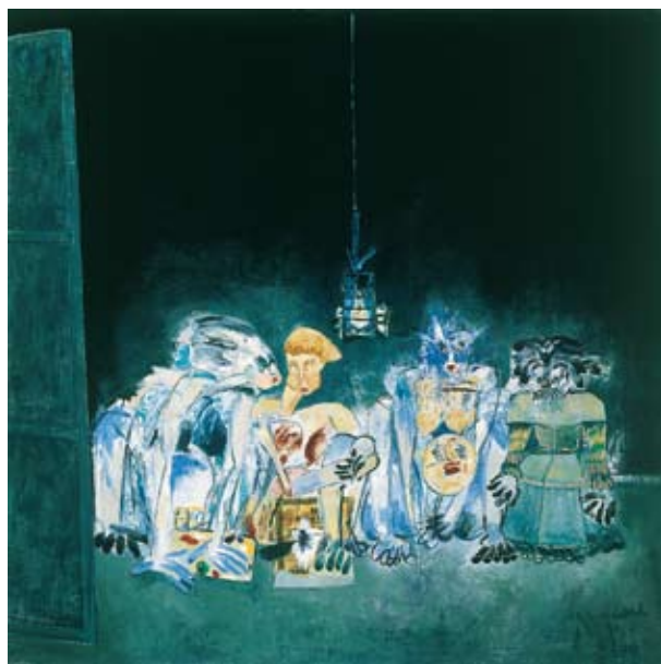
Ménines accroupies , 1982, 230x230 cm, Huile sur toile