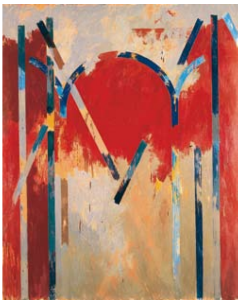
Arches , 1978, 230x190 cm, Huile sur toile

«Je suis dans la couleur comme un poisson dans l'eau» Louis Cane