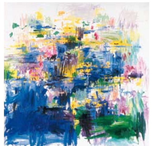
Nymphéas , 1995/96, 200x200 cm, Huile sur toile